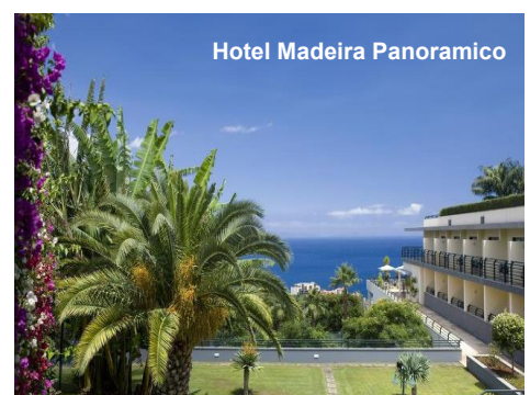
Hotel Madeira Panoramico

Diese Reise ist für Gäste mit eingeschränkter Mobilität nicht geeignet.