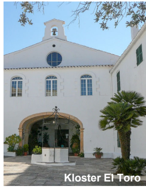
Kloster El Toro

diesen auch und haben anschließend Zeit für eigene Entdeckungen. Den Naturhafen von Mahón erleben Sie bei einer Bootsfahrt . Wir machen uns auf den Weg an die Südküste zur malerischen Siedlung Binibeca . Nicht weit entfernt versteckt sich die Naturhöhle Cova d'en Xoroi . Sie gehört zu den bekanntesten Sehenswürdigkeiten. Aussichtsterrassen, Tunnel und verschwegene Nischen laden zum Erforschen und Verweilen ein. Genießen Sie von hier den fantastischen Ausblick über die Steilküste! F, A