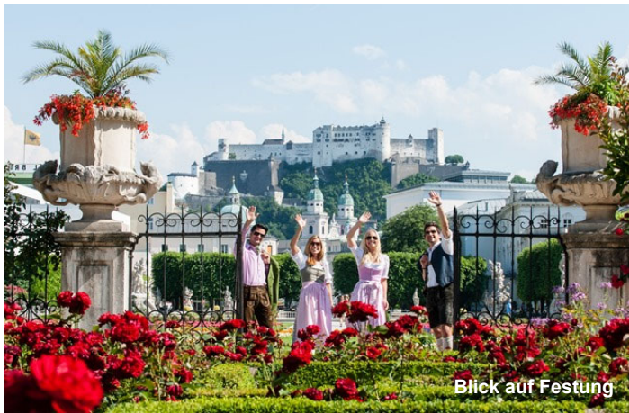
Blick auf Festung