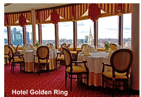
Hotel Golden Ring

Diese Reise ist für Gäste mit eingeschränkter Mobilität nicht geeignet.