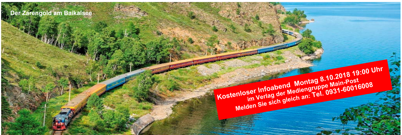
Der Zarengold am Baikalsee

Kostenloser Infoabend Montag 8.10.2018 19:00 Uhr im Verlag der Mediengruppe Main-Post Melden Sie sich gleich an: Tel. 0931-60016008