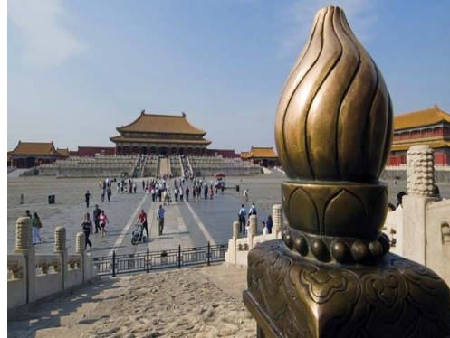
Peking Verbotene Stadt

Frühaufsteher sehen heute wunderschöne Naturlandschaften in der zentralen Mongolei. Morgens erreichen Sie die mongolische Hauptstadt Ulaan Baatar . Nach dem Zimmerbezug im zentral gelegenen Hotel der guten Mittelklasse erwarten Sie eine informative Stadtrundfahrt und der skurrile