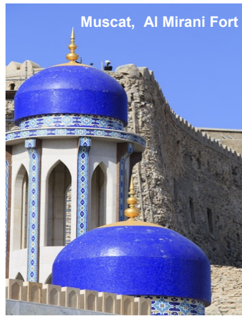
Muscat, Al Mirani Fort